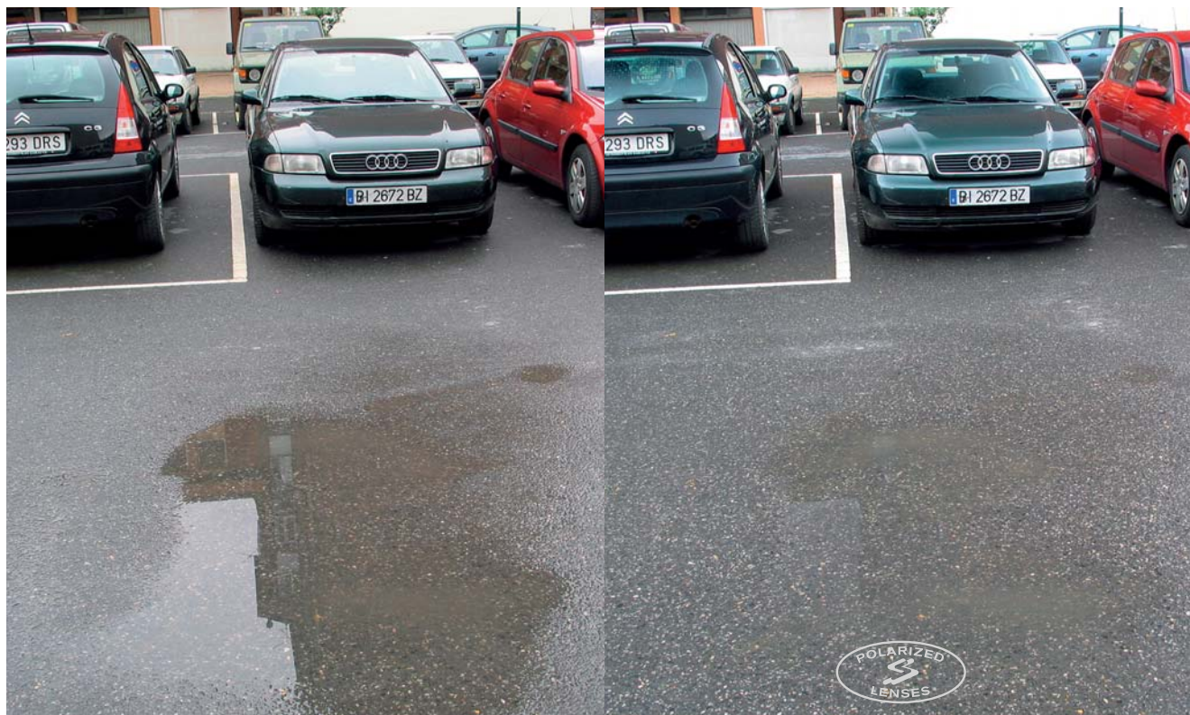
WITHOUT POLARIZATION SIN POLARIZACIÓN