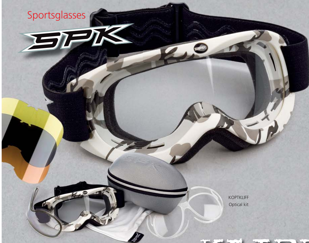
KOPTKLIFF Optical kit