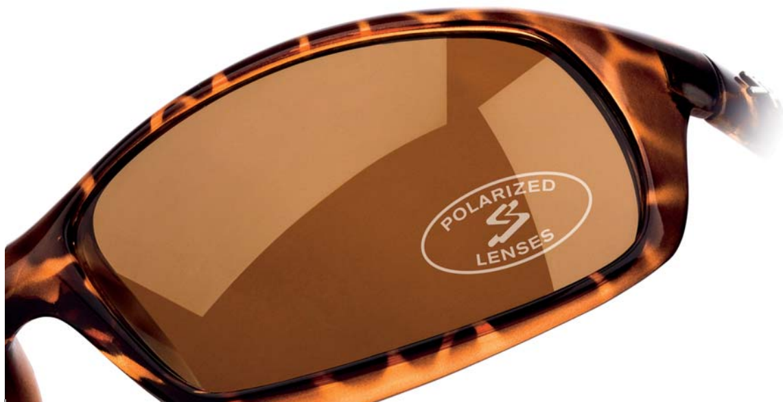
WITH POLARIZATION CON POLARIZACIÓN