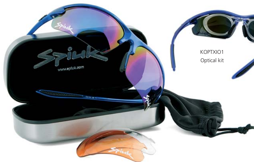
KOPTXIO1 Optical kit